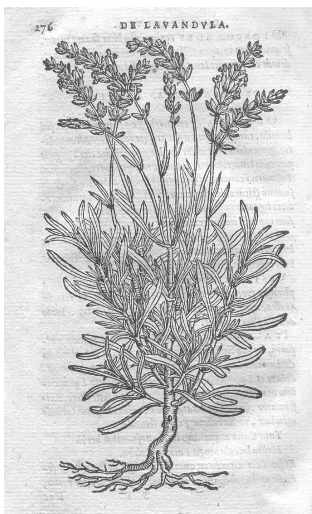
Fig. 3 - volume 17, p. 276

Legatura coeva in pergamena floscia, mancante della porzione superiore del dorso. Carta incollata parzialmente staccata e mancante, verde sul dorso e marmorizzata sui piatti. Fogli di guardia mancanti. Gore di umidità all'angolo superiore. Stato: discreto.