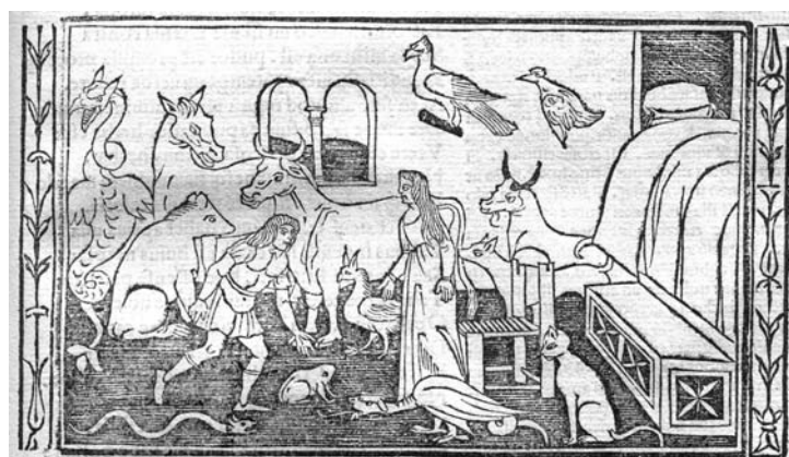
Fig. 4 - volume 3, c. 150 recto