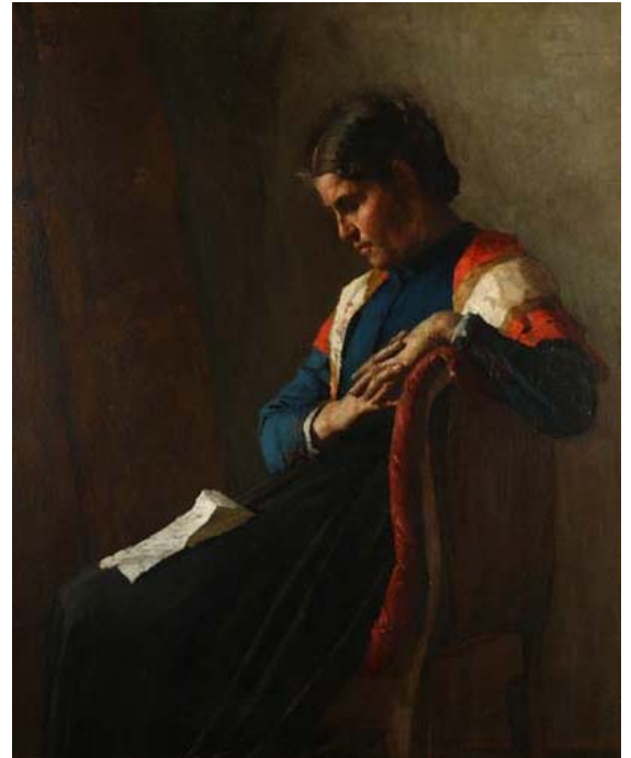
Giuseppe Pellizza da Volpedo - La donna dell'emigrato