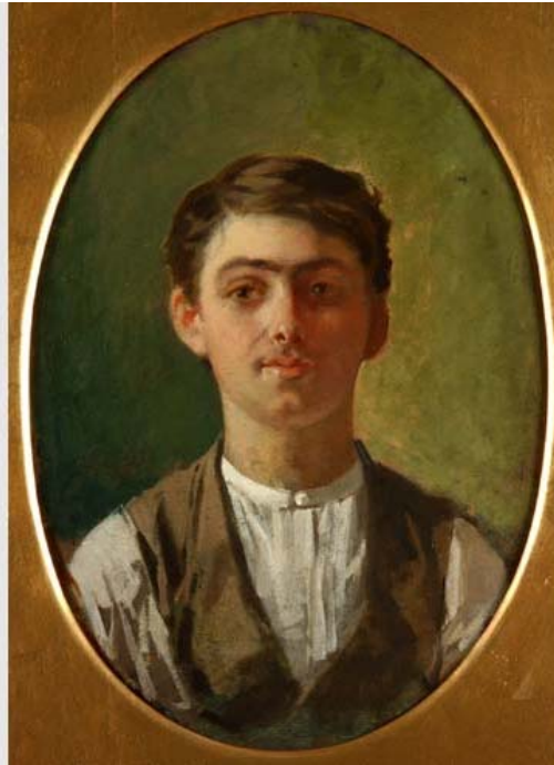
Giuseppe Pellizza da Volpedo – Autoritratto

Trasferimento a Tortona in bicicletta con un percorso pianeggiante e gradevole, visita alla Pinacoteca della Fondazione Cassa di Risparmio, dove sono conservate importanti tele di Pellizza e dei suoi contemporanei, fra cui Plinio Nomellini e altri divisionisti.